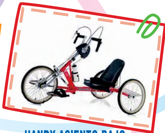
HANDY ASIENTO BAJO

La utilización de estas bicicletas es Gratuita.