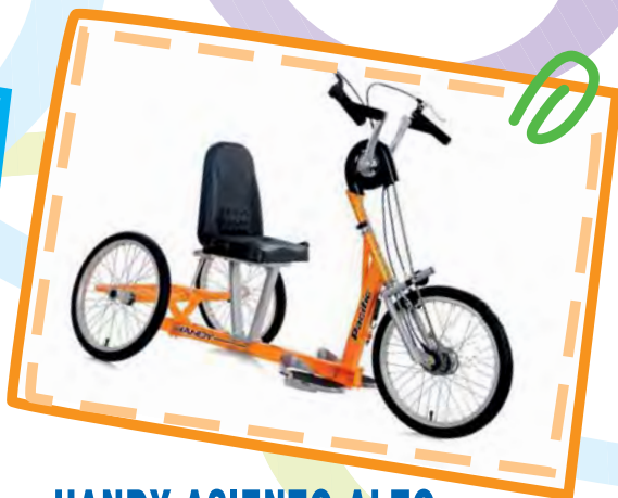
HANDY ASIENTO ALTO